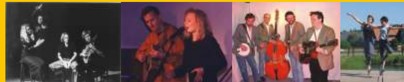
Grupo Alegria Iki Dünya GroundSpeed Tanzschule Watkins