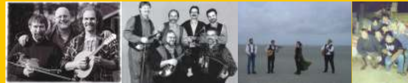
Liederjan Schmelztiegel Laway De Drangdüwels