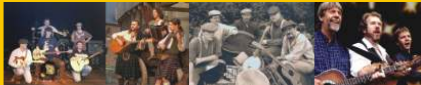
Connemara Stone Co. Rapalje An Rinn McCalmens