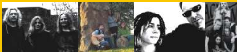
An Ermenig Na Cloiche Bui Bardic Lack of Limits